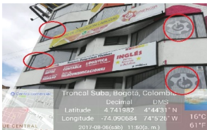
Fotografía No 3. Publicidad (logos) incorporada en las ventanas de la edificación donde opera el establecimiento denominado SINERGIA .