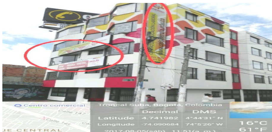
Fotografía No 2. Fachada del predio donde se ubica el establecimiento de comercio objeto a estudio donde se puede observar que el establecimiento cuenta con más de un aviso por fachada los cuales superan el antepecho del segundo piso.