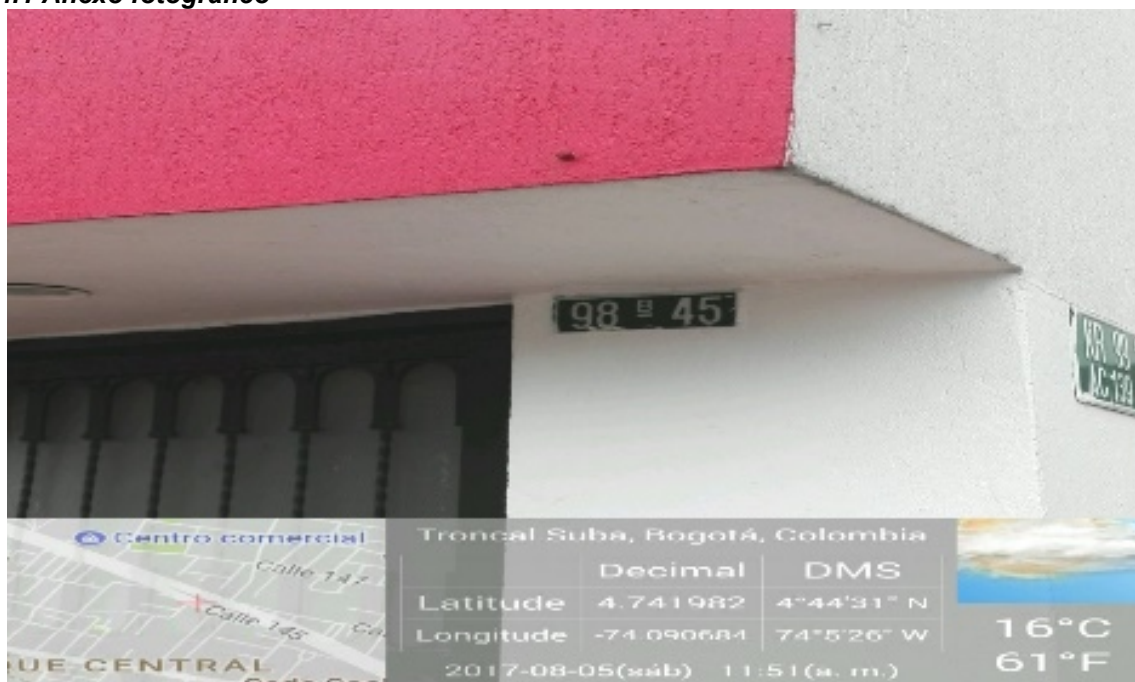
Fotografía No 1. Nomenclatura del predio donde se ubica el establecimiento objeto a estudio